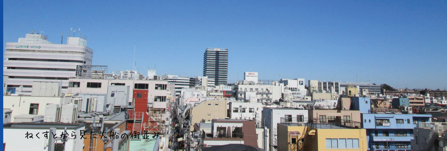
ねくすとから見た大船の街並み